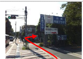
⑦ 市民プラザ前の信号を右折