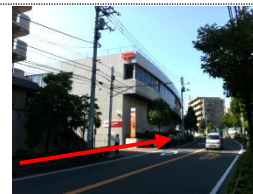
③ 道なりに直進、左手に高津郵便局