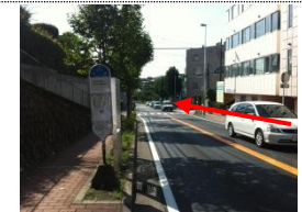
⑥ 緩やかな下り坂を直進 「大原」バス停があります