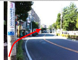
② 道なりに直進してください