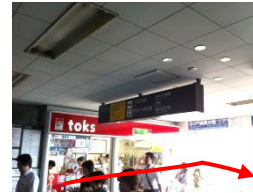
① 改札を出て、右へお進みください