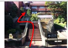
⑧ 階段を上がって頂くと入口があります