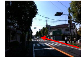
⑤ 道なりに直進してください