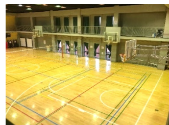
1面にネットを張った場合