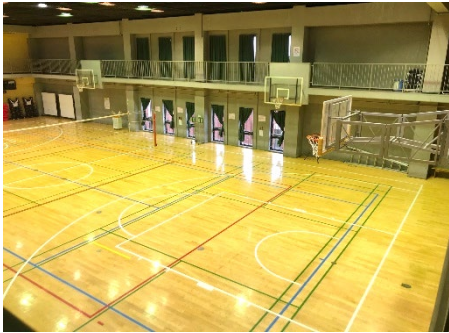
1面にネットを張った場合