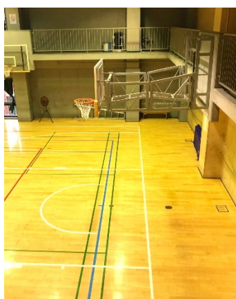
ゴールがラインに入り込む様子