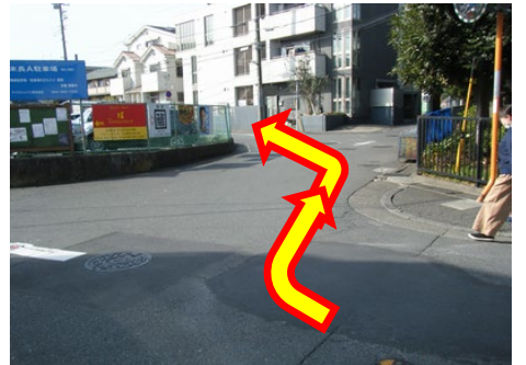
④右手の末長姿見台公園を過ぎたら、右手の方向へ進みます。