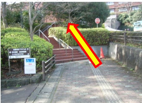
⑨最後の難関、67段の階段を上ります。