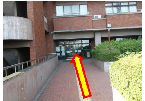
⑩扉を開けたら、すぐ右がメインフロントです。川崎市民プラザへ、ようこそ！

※現在、感染症対策の為、こちらの扉は閉め切っております。右折して建物に沿って進み、西玄関よりお入りください。