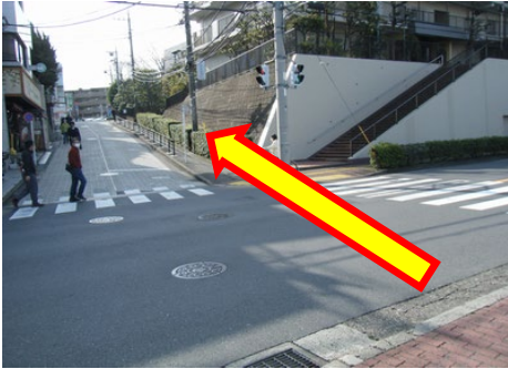
③左手のマンション手前の上り坂へ左折します。