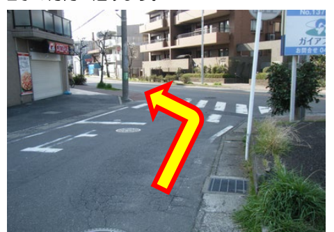
⑥市民プラザ通りに出たら左へ進みます。