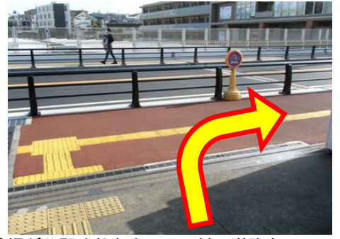
②梶が谷駅改札を出て目の前の道路を右へ向かいます。