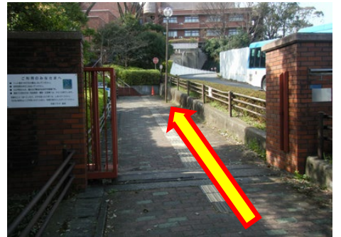
⑧市民プラザの門を直進します。