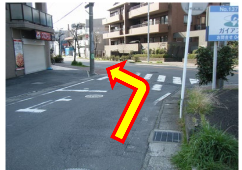
⑥市民プラザ通りに出たら左へ進みます。