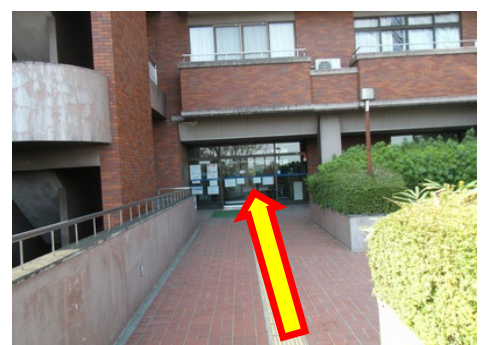
⑩扉を開けたら、すぐ右がメインフロントです。川崎市民プラザへ、ようこそ！