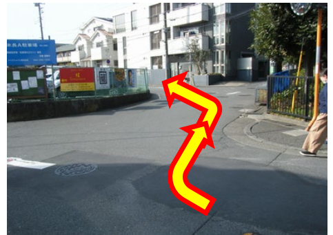
④右手の末長姿見台公園を過ぎたら、矢印の方向へ進みます。