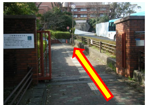
⑧市民プラザの門を直進します。