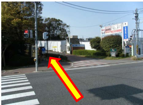
⑦坂を下りきって、市民プラザ前の信号を渡ります。