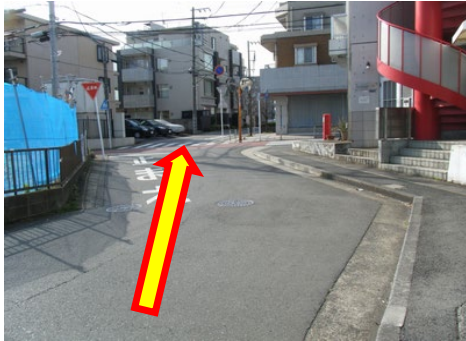
⑥道なりに直進します。