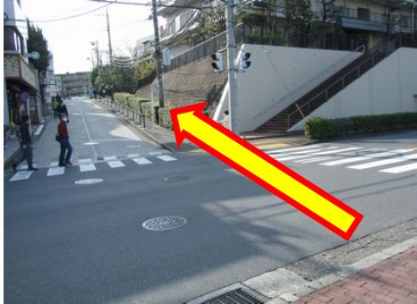
③左折して2つ目の信号を渡り上り坂を直進します。