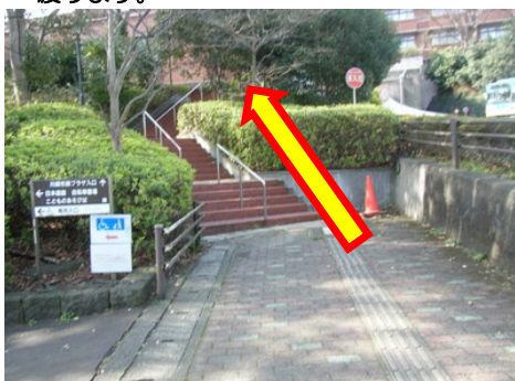
⑨最後の難関、67段の階段を上ります。