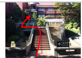
⑧ 階段を上がって頂くと 入口があります