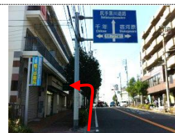
④ 「梶ヶ谷駅入口」交差点を左折し、 市民プラザ通りを直進